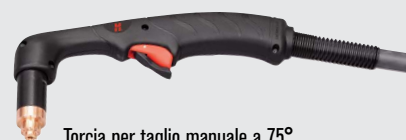
Torcia per taglio manuale a 75°

Stili di torce Duramax standard (per un numero maggiore di opzioni di torcia, consultare il sito Web www.hypertherm.com )