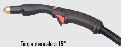
Torcia manuale a 15°